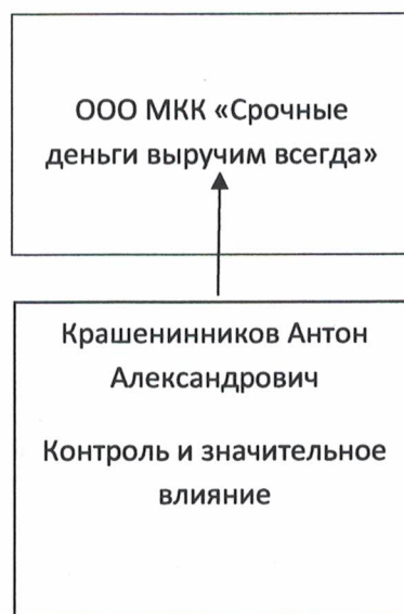
СХЕМА ВЗАИМОСВЯЗЕЙ АКЦИОНЕРОВ (УЧАСТНИКОВ) МИКРОФИНАНСОВОЙ КОМПАНИИ И ЛИЦ, ПОД КОНТРОЛЕМ ЛИБО ЗНАЧИТЕЛЬНЫМ ВЛИЯНИЕМ КОТОРЫХ НАХОДИТСЯ МИКРОФИНАНСОВАЯ КОМПАНИЯ